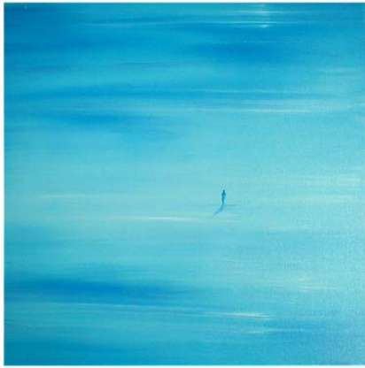
Blaue Stunde (Öl auf Leinwand 2009)

Mein heimlicher Favorit unter Gabrieles Bildern ist „Die blaue Stunde“: